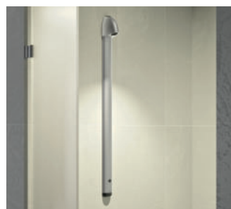
Przykład instalacji, elektroniczny panel natryskowy SPORTING 2 SECURITHERM Nr 714900

Rysunki i zdjęcia są dostępne na naszej stronie internetowej delabie.pl , rubryka Prasa